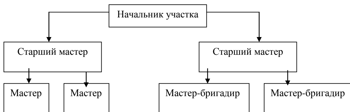
Рис.2. Линейная структура управления персоналом [5].

От текста рисунок отделяется пропуском строки. Данные в рисунке могут быть представлены шрифтом 12 и одинарным межстрочным интервалом.