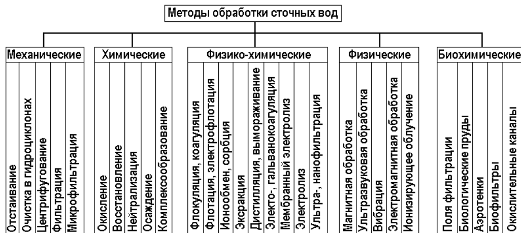
Рис. 1.1 Классификация методов очистки сточных вод

Пример оформления иллюстраций и таблиц в выпускной квалификационной работе бакалавра