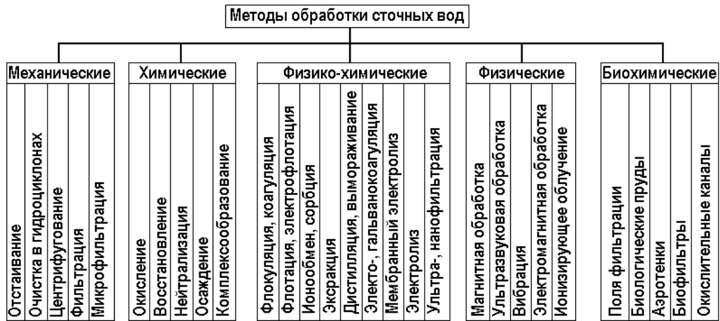
Рис. 1.1 Классификация методов очистки сточных вод

Пример оформления иллюстраций и таблиц в выпускной квалификационной работе бакалавра