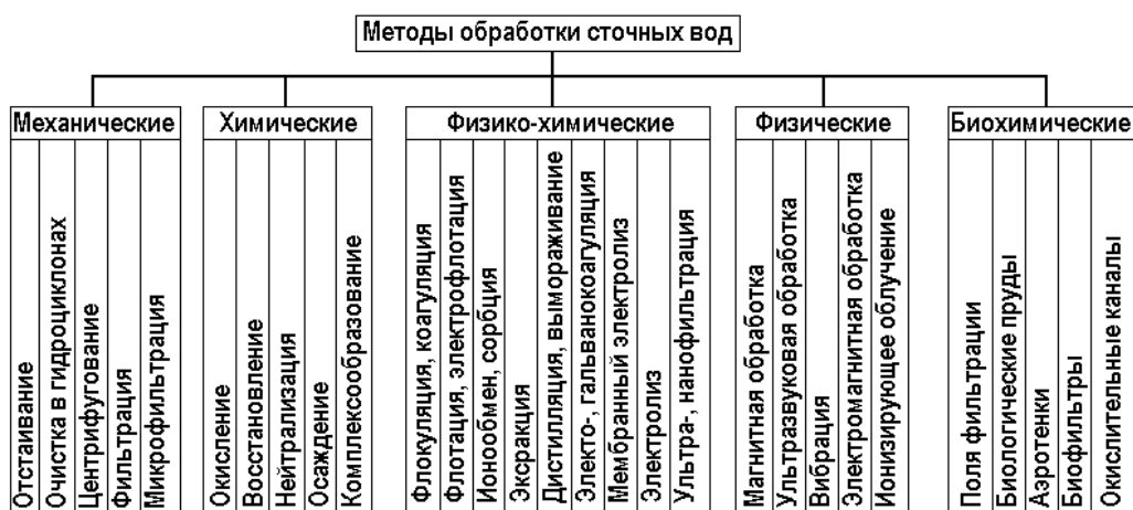
Рис. 1.1 Классификация методов очистки сточных вод

Пример оформления иллюстраций и таблиц в выпускной квалификационной работе бакалавра